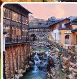
เมืองโบราณเหย้าหู