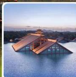
พิพิธภัณฑ์ไดโนเสาร์ กวางฟู่หลิน