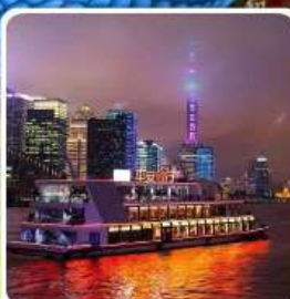
ล่องเรือแม่น้ำหวงผู่