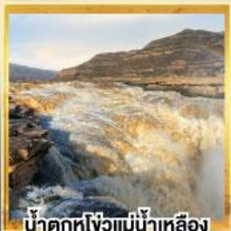
น้ำตกหูโง่วแม่น้ำเหลือง