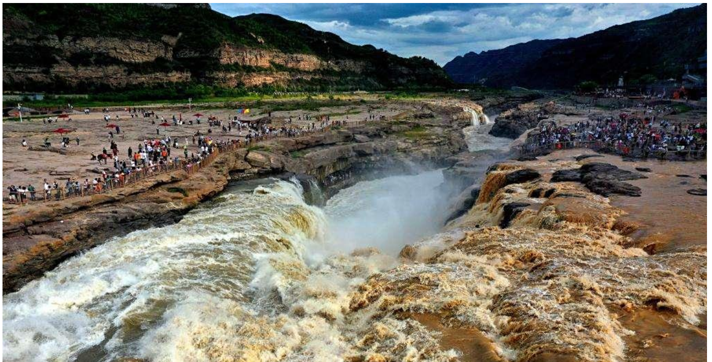
บ่าย นำท่านเดินทางสู่ น้ำตกหูโซ่ว (ระยะทาง 83 ก.ม. ใช้เวลาเดินทางประมาณ 1.5 ชั่วโมง) น้ำตกสี่เหลี่ยมที่ใหญ่ที่สุดในโลก ตั้งอยู่บริเวณหุบเขาจินชานตอนกลางของแม่น้ำเหลือง ความงดงามของน้ำตกหูโซ่วมาจากการรวมตัวของแม่น้ำเหลือง หุบเขาอันลึก และภูมิประเทศแบบที่ราบสูงโล่งกว้าง เป็นแหล่งท่องเที่ยวที่สะท้อนถึงความยิ่งใหญ่ของธรรมชาติและมรดกทางวัฒนธรรมที่สืบทอดมาอย่างยาวนาน ที่นี่แม่น้ำเหลืองที่กว้างกว่า 300 เมตรหดตัวลงเหลือเพียง 50 เมตรก่อนที่จะไหลทะลักลงสู่หินเบื้องล่างลึกกว่า 30 เมตร คล้ายกับน้ำที่ไหลจากปากหม้อ จึงได้ชื่อว่า “หูโซ่ว” หรือ “ปากหม้อ” เสียงของน้ำตกดังกึกก้องราวกับฟ้าผ่า เกิดเป็นปรากฏการณ์ “หมอกมุดไต้้น้ำ” “สายรุ้งเชื่อมฟ้า” และ “มังกรร่อนคลื่น น้ำตกหูโซ่วเป็น