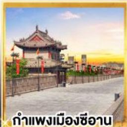
กำแพงเมืองซีอาน