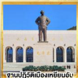
ฐานปฏิวัติเมืองเหยียนอัน