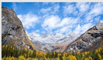
ภูเขาสี่ดรุณี (หุบเขาชวงเจียวโกว)