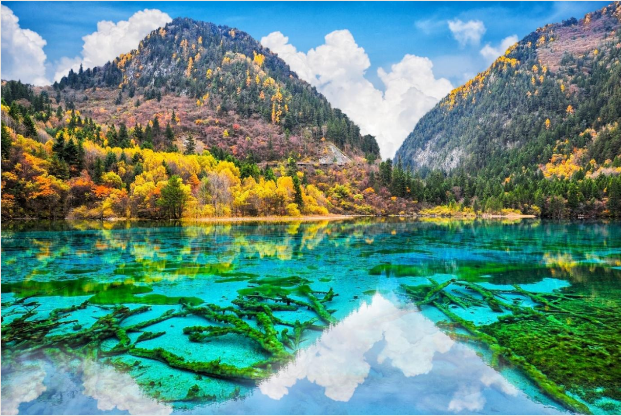
ฤดูใบไม้ร่วง (AUTUMN)