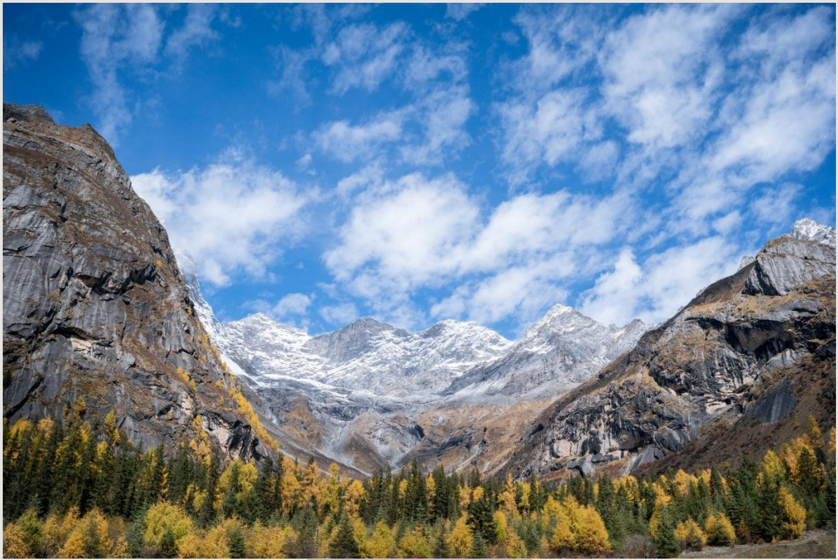
ฤดูใบไม้ร่วง (AUTUMN)