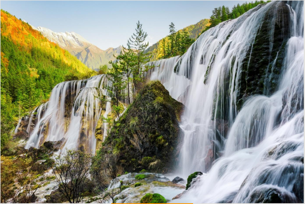
ฤดูใบไม้ร่วง (AUTUMN)