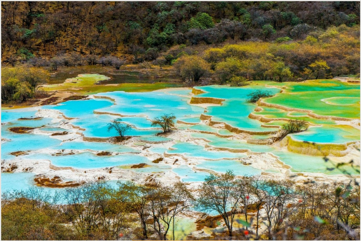
ฤดูใบไม้ร่วง (AUTUMN)