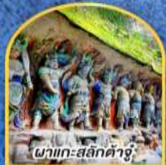
พาแกะสลักต้าจู๋