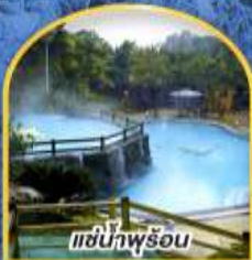
แช่น้ำพุร้อน