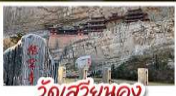
วัดเสวี่ยนหลง

บินตรงทยนเฉ่ง ชานซี เที่ยวสามมรดกโลก พุทธคีรีอุ๊กซาน กำหยนถ้ง เมืองโบราณผิงเหยา