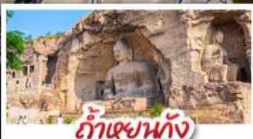
ถ้ำเฉยหนั่ง