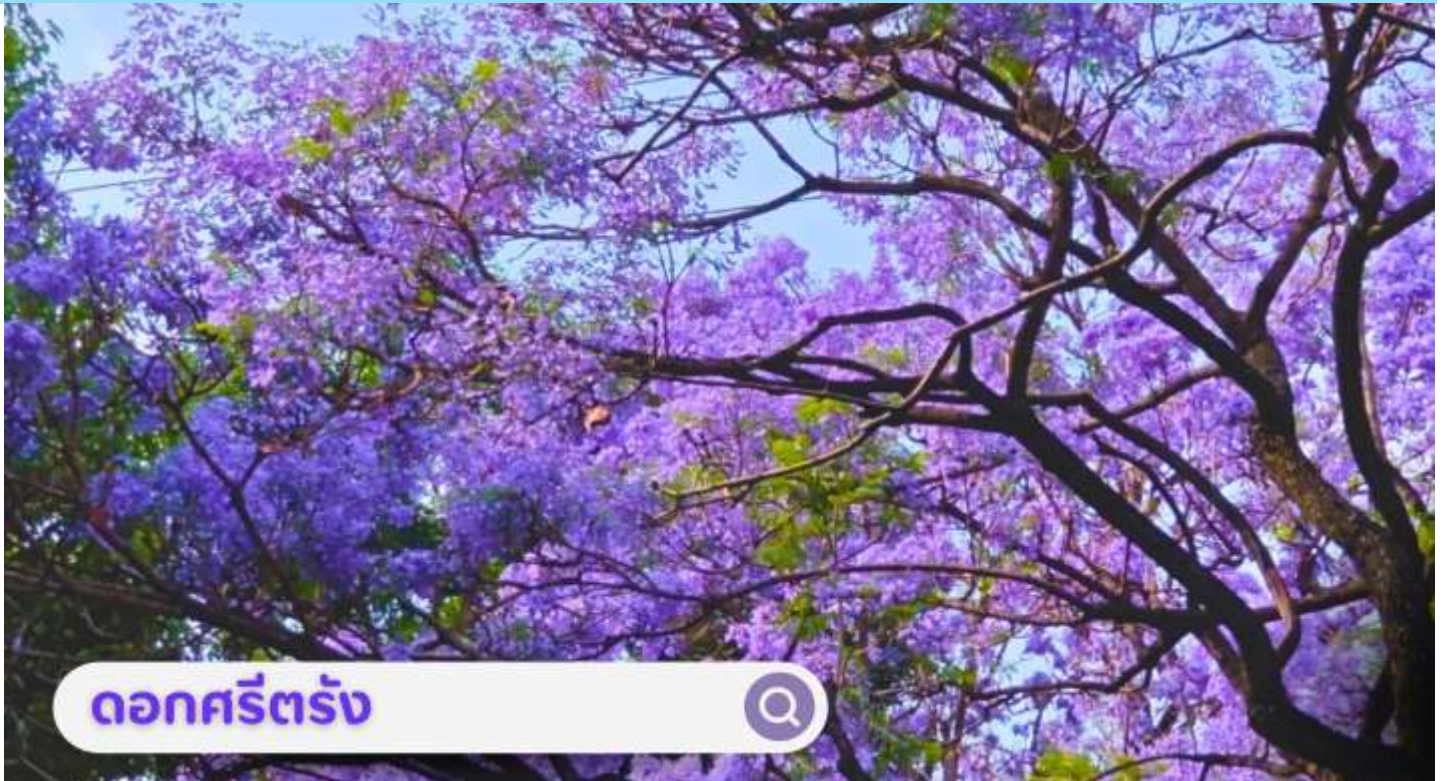
ดอกศรีตรัง

เดือนกันยายน: นำท่านชม ตลาดดอกไม้ไต้หวัน เป็นตลาดค้าส่งดอกไม้ที่ใหญ่ที่สุดของจีน เปิดทำการค้าตลอด 24 ชั่วโมง ไม่มีช่วงเวลาปิดทำการ โดยในปี 2566 ตลาดดอกไม้ไต้หวันมีปริมาณการซื้อขายดอกไม้โดยเฉลี่ยรวม 13,540 ล้านบาท คิดเป็นมูลค่า 13,570 ล้านบาท ถือเป็นตลาดค้าปลีก-ส่ง ผลิตผลทางการเกษตรที่ใหญ่ที่สุดในประเทศจีนอีกด้วย