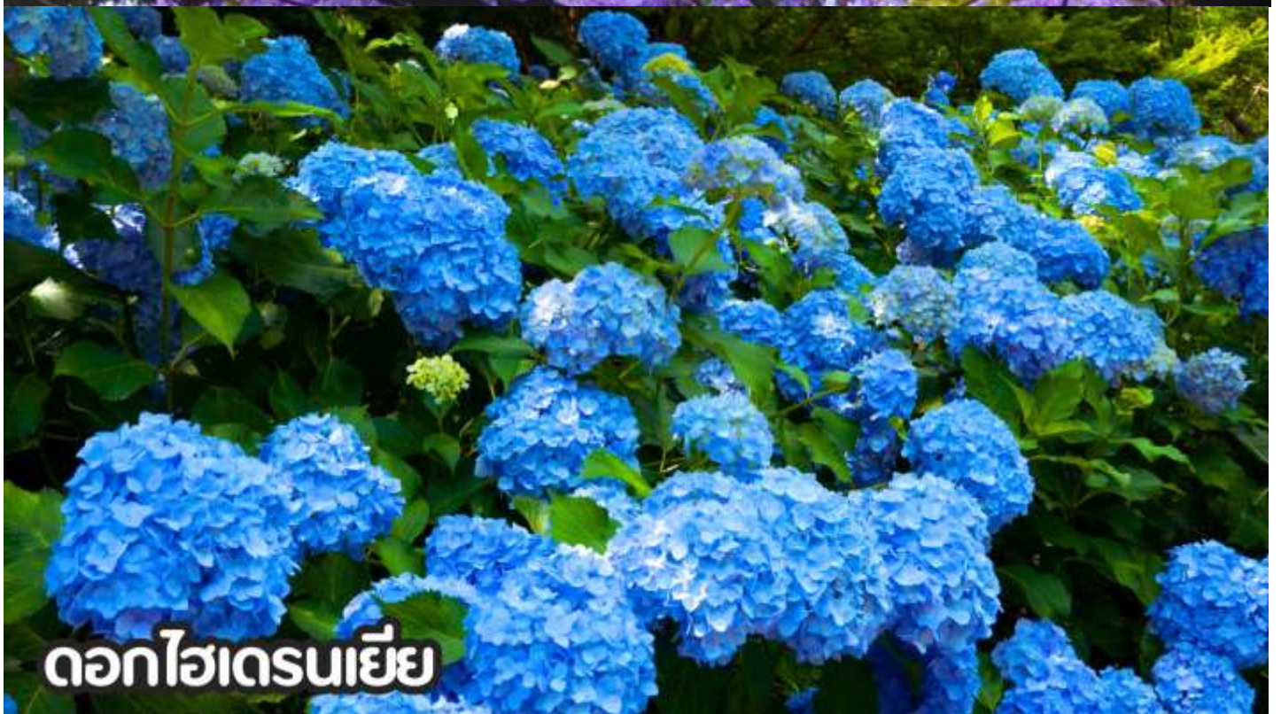
ดอกไฮเดรนเยีย

**หมายเหตุ: โปรแกรมชมดอกไม้ช่วงเดือน พ.ค. - ต.ค.2569 ในช่วง ณ วันเดินทางดังกล่าว หากดอกไม้ยังไม่บานหรืออาจจะร่วงหล่น..ทั้งนี้ขึ้นอยู่กับสภาพอากาศของแต่ละปี ทางบริษัทไม่ประกันติ และไม่สามารถกำหนดการบานของดอกไม้ได้ ทางบริษัทฯ ขอสงวนสิทธิ์ปรับเปลี่ยนรายการท่องเที่ยวอื่นทดแทนนะคะ รบกวนท่านโปรดทราบและทำความเข้าใจค่ะ**