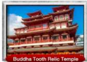
Buddha Tooth Relic Temple