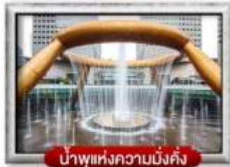
น้ำพุแห่งความมั่งคั่ง