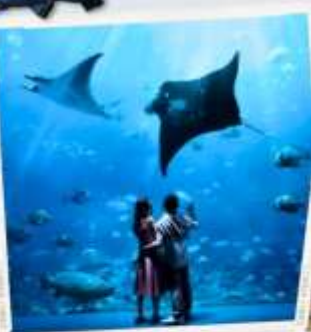
ZONE 7 : FAR FAR AWAY