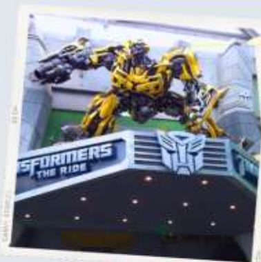
ZONE 1 : HOLLYWOOD