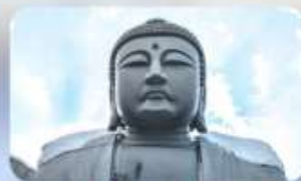
พระใหญ่อะตะมะ ไดบุตสึ