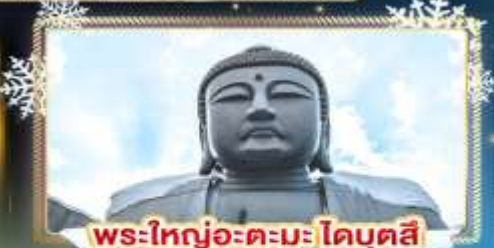
พระใหญ่อะตะมะโคบุตสึ