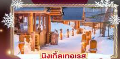
บึงเกลือเทอโรส