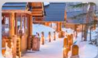
นิงเกิ้ลเทอเรส