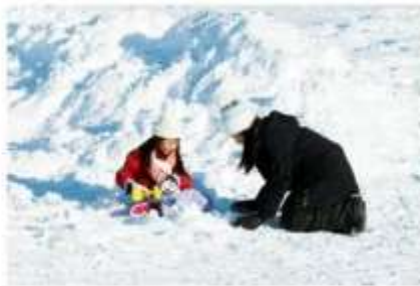
Playing in the snow