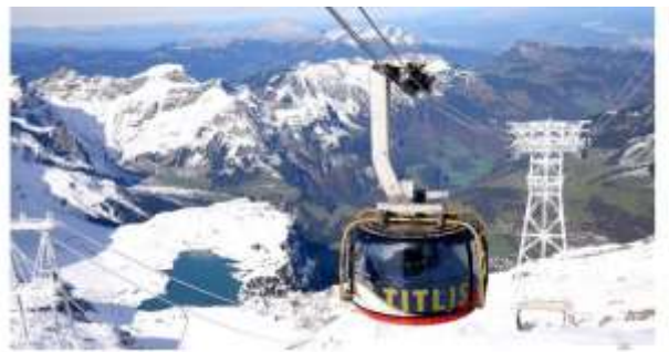
Highlight ! กระเช้าโรแตรเป็นกระเช้าไฟฟ้าหนักได้ 360 องศา แห่งแรกของโลก จุผู้โดยสารได้ 80 คน ใช้เวลาประมาณ 5 นาที ในการขึ้นสู่ยอดเขา

จากนั้นนำท่านเดินทางสู่ เมืองแองเกลเบิร์ก (Engelberg) (ระยะทาง 36ก.ม. / 1 ชม.) หมู่บ้านเล็กๆ ตั้งอยู่เชิงเขา ที่ล้อมด้วยเทือกเขาแอลป์ เป็นที่ตั้งของสถานีขึ้นคิตลิส จากนั้นนำท่านนั่งกระเช้าโรแตรเพื่อเดินทางขึ้นสู่ ยอดเขาคิตลิส (Titlis) (ค่าขึ้นกระเช้าไป-กลับ รวมในค่าทัวร์แล้ว) ให้ท่านจะได้สัมผัสกับกระเช้าทรงกลมที่เรียกว่า โรแตร เคเบิลคาร์ ในขณะที่เคลื่อนที่ขึ้นไปเรื่อยๆ ท่านจะเห็น เทือกเขาแอลป์ ธารน้ำแข็ง และทะเลสาบเบื้องล่าง ในวันที่อากาศแจ่มใส คุณสามารถมองเห็นยอดเขา Jungfrau joch และ Eiger ได้อีกด้วย