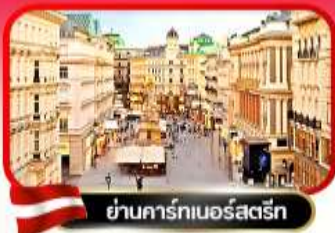
ย่านคาร์ทเนอร์สตรีก