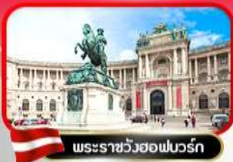
พระราชวังฮอฟบวร์ก