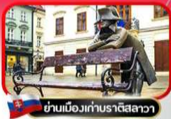
ย่านเมืองเก่าปราทิสลาวา

เที่ยวเมืองสวยริมทะเลสาบ ฮัลล์สตัดท์ • ชมเมืองไข่มุกแห่งโบฮีเมีย เซสกี คุรมลอฟ • ปราก • เวียดนาม • ซัปโปโปะพาร์นดอร์ฟ เอาก์เลิน