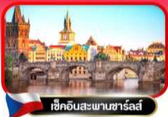
เชคอินสะพานชาร์ลส์