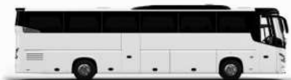
ตัวอย่างรถทัวร์ 1 คัน

ค่าที่พักตามที่ระบุในรายการหรือเทียบเท่าระดับเดียวกัน (ห้องพักละ 2 ท่าน) หากประเภทห้องพักท่านริเวรสนาเต็ม อาทิ เช่น ริเวรสห้องพักเป็น TWIN BED หรือ DOUBLE BED ทางบริษัทขอสงวนสิทธิ์ในการปรับประเภทห้องพัก เป็นตามที่โรงแรมมีอยู่ โดยไม่ต้องแจ้งให้ทราบล่วงหน้า