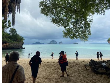
ถ่ายรูปเกาะไก่ ลงเล่นน้ำ เกาะไก่ ชมปะการังหลากสี ปลาการ์ตูน และ ปลานานาชนิด