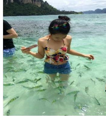
ชมทะเลแหวก Unseen in Thailand เชื่อมระหว่าง เกาะทับ และ เกาะหม้อ