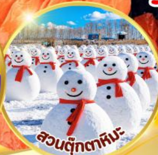
สวนตุ๊กตาหิมะ