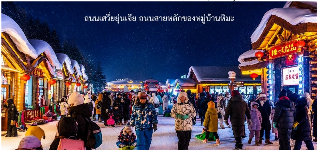
ถนนเสวี่ยยูนเจีย ถนนสายหลักของหมู่บ้านหิมะ

นอกจากนี้ยังมีกิจกรรมเดินเขากลางคืน ทั้งภูเขาถูกประดับไฟ ส่องสว่างไสวสวยงามทั้งคืน เดินทางตามบันได เชื่อมไปจนถึงระเบียงทางเดิน ที่จะทำให้ท่านเห็นความงามของหมู่บ้านในยามค่ำคืนจากมุมสูง นำท่านเดินชมบรรยากาศบน ถนนเสวี่ยยูนเจีย ถนนสายหลักของหมู่บ้านหิมะ ที่เต็มไปด้วยร้านค้าของที่ระลึก ร้านอาหารท้องถิ่น และร้านกาแฟน่ารัก ๆ ถนนสายนี้ถูกตกแต่งด้วยไฟประดับและโคมแดงสไตล์จีน เพิ่มเสน่ห์ให้บรรยากาศอบอุ่นและมีชีวิตชีวา ท่านสามารถช้อปปิ้งสินค้าแฮนด์เมด พร้อมถ่ายภาพเก็บความทรงจำในมุมสวย ๆ ของหมู่บ้าน